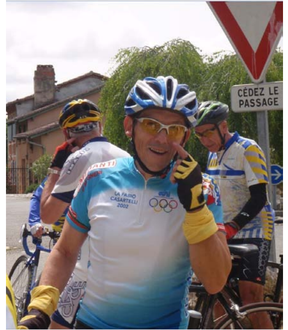
Avec le maillot « collector » de la Casartelli !!