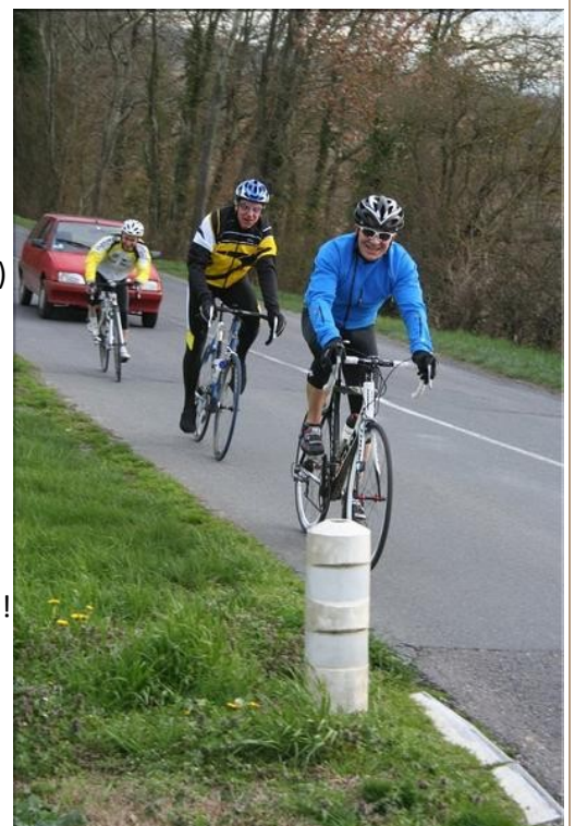
Les 3 « Fend la bise » !!!