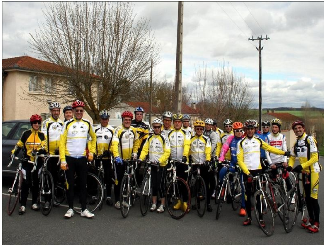
23 Ccviens au départ