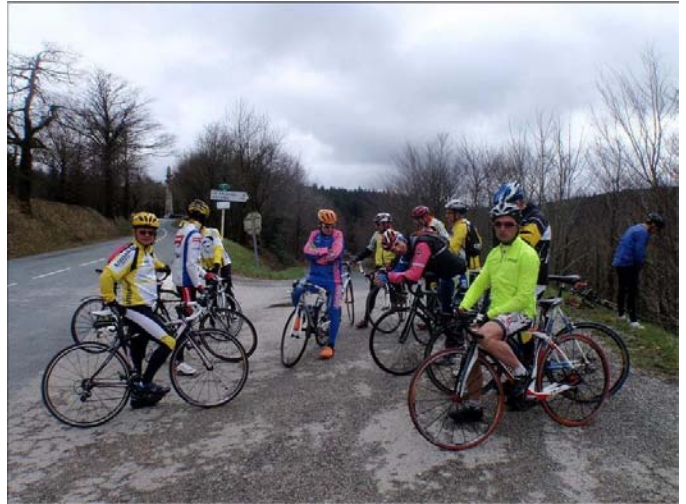
Déjà le sommet pour le groupe 1 mais ou est passé Didier ???