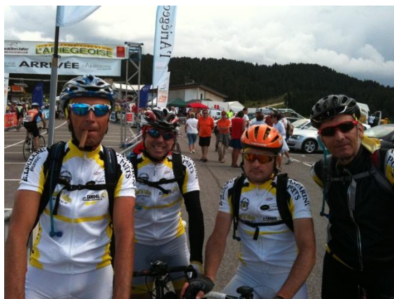
Ariègeois 2010, à l'aise en fumant le cigare...