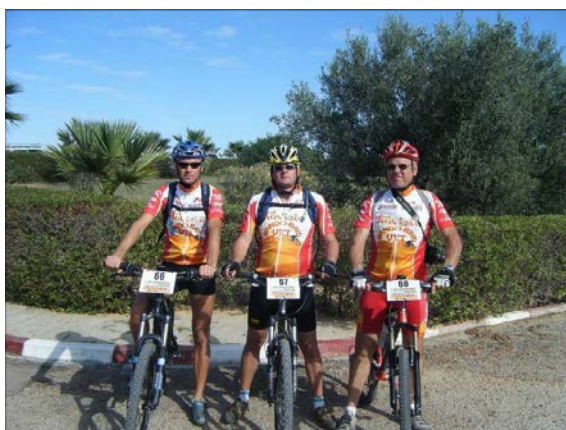
Rallye-raid 2009 en Tunisie.

Cela se passe en 2006, c'est une course à Grenade sur Garonne. Je lâche un groupe et je reviens sur un échappé. A ce moment là j'ai les jambes, je décide de jouer la gagne et je finis seul sur 10 km. C'est ma première victoire individuelle sur route, souvenirs fabuleux, plein d'émotions, avec la coupe et le bouquet de fleurs !